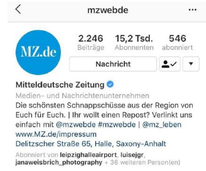
Mobile Ansicht vom Instagram Kanal mzwebde | Followerzahl Stand Februar 2019

Die Story sind 24 h auf dem Profil sichtbar. Damit sie länger sichtbar sind, kann man sie als „Story-Highlight“ abspeichern.